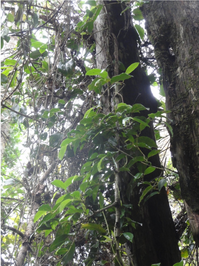
Image d'une liane de tsiperifery rampant sur son tuteur